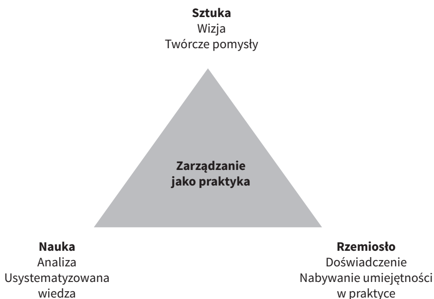
Rysunek 1. Zarządzanie jako sztuka, rzemiosło i nauka

Inne ujęcie akcentuje z kolei, że zarządzanie jest „praktyką, której można się nauczyć głównie z doświadczenia i która jest mocno osadzona w kontekście” (Mintzberg, 2012, s. 27). Na rysunku 1 zaprezentowano zarządzanie jako praktykę opisaną na nauce, rzemiośle i sztuce.