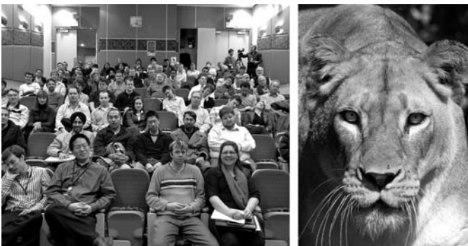
Rysunek 2.1. Ty widzisz to, co po lewej, ale dla mózgu wygląda to tak, jak widok po prawej

Prawdziwe zagrożenie wiąże się zawsze z tłumem. Podczas koncertów wielkich gwiazd rocka, takich jak The Who, Pearl Jam czy Rolling Stones, dochodziło do śmiertelnych wypadków wśród fanów, ale poza tajemniczą eksplozją perkusisty zespołu Spinal Tap przypadki śmierci na scenie są niezmiernie rzadkie. To właśnie nieobliczalna natura tłumów sprawia, że wiele osób woli siedzieć przy przejściu, aby móc jak najszybciej uciec przed niebezpieczeństwem czy choćby nudą. Kiedy jednak jesteśmy na scenie, wówczas nie tylko znajdujemy się blisko wyjścia ewakuacyjnego, ale nasze zaśląbnięcie, przewrócenie się czy atak serca będą na tyle widoczne, że ktoś z obsługi natychmiast wezwie pomoc. Kiedy więc staniesz przed widownią po raz kolejny, postaraj się zapamiętać, że jesteś najprawdopodobniej najbezpieczniejszą osobą na sali. Problem w tym, że nasz mózg jest zaprogramowany do myślenia odwrotnego, patrz rysunek 2.1.